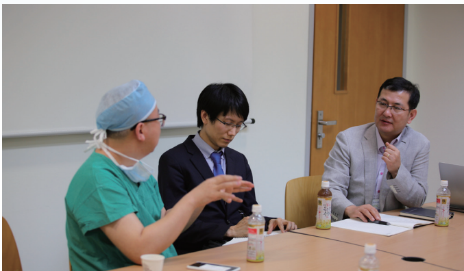
Advanced HeTAC 진행 모습