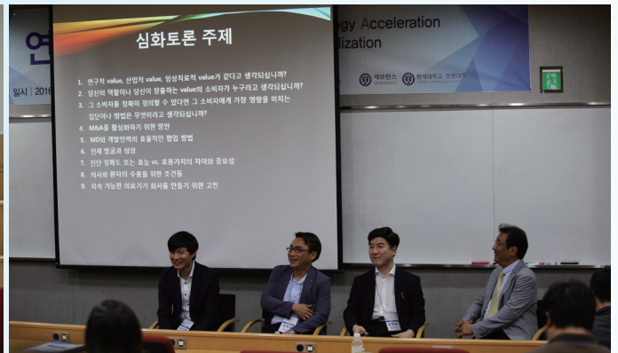
심화토론 진행 모습