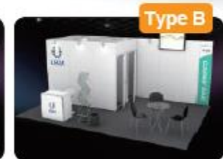
라이팅박스 그래픽 제공