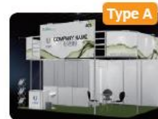
부스 상단 그래픽 제공