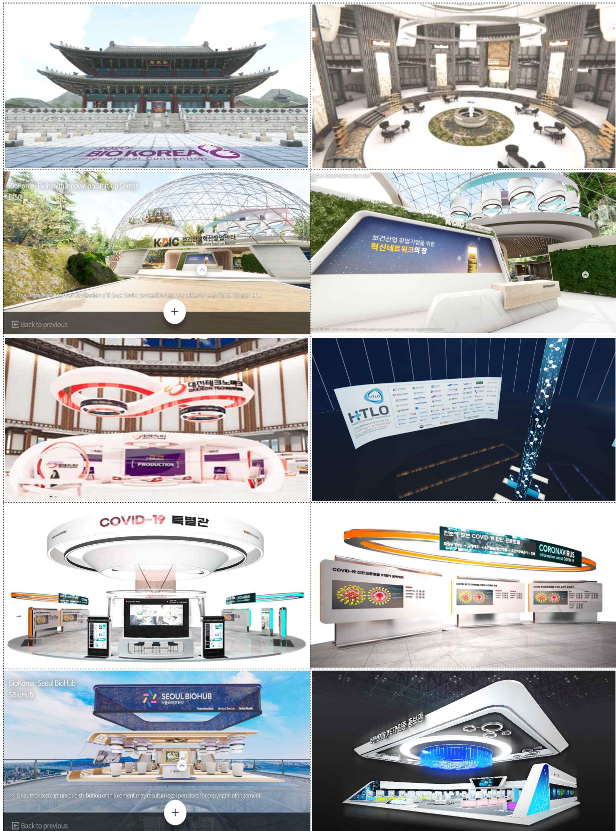
▲ 가상전시 공간 및 부스 예시