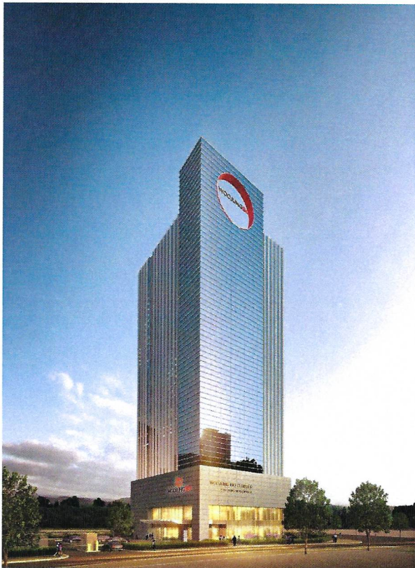
◎ 클러스터 본부 규모