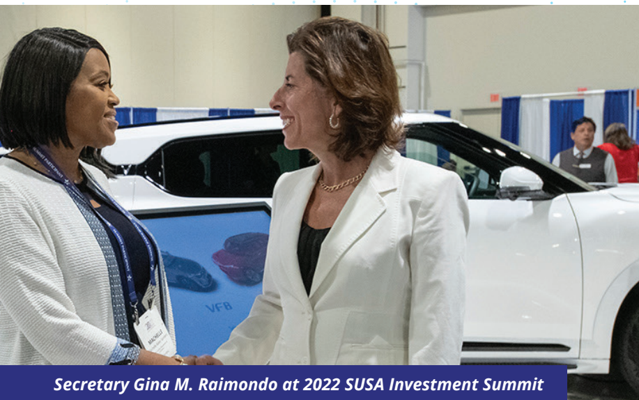
Secretary Gina M. Raimondo at 2022 SUSA Investment Summit